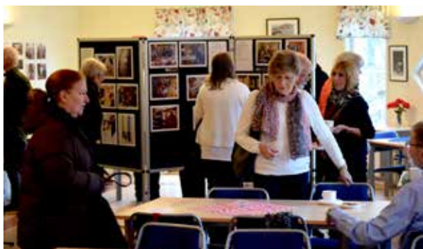
Utställningen var uppskattad och välbesökt.