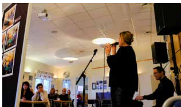
CK Duo bjöd på skön underhållning.

För tredje året i rad anordnade Minnebergs fotoklubb en fotoutställning i Badviken den 18-19 november. Årets tema var Minnebergs ideella föreningar och tillsammans med fotona kunde man få information om vilka föreningar som finns i Minneberg, hur man blir medlem och vad det kostar.