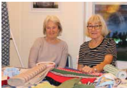
Medlemmar från vävstuga 2 och...