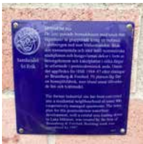
Kulturskylt om Minneberg

Samfundet S:t Erik i Stockholm uppmärksammar kulturhistoriskt och arkitektoniskt intressanta byggnader i Stockholm och har nu valt ut Minneberg för en av sina kulturskyltar.