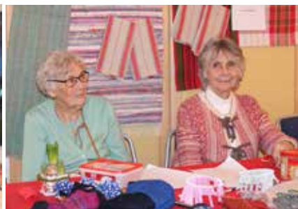
...vävstuga 1 fanns på plats.

En tradition i Minneberg är vävstugornas julmarknad vid första advent. I år hölls den i Badviken och var som vanligt uppskattad av de boende i området. Många fina hantverk visades upp och man kunde vinna fina priser på lotterierna.