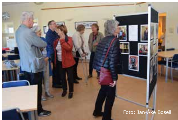
På utställningsskärmar kunde man läsa om de olika föreningarna.

Lördag 21 april hade intresseföreningarna i Minneberg öppet hus i samarbete med Minnebergs samfällighetsförening. Cirka 45–50 boende kom till Badviken för att träffa föreningarnas representanter och fika tillsammans. På plats fanns Minnebergs fotoklubb, MinnebergsSeniorerna, Båtklubben, Bokcafét, Vävstugorna och Bridgeklubben.