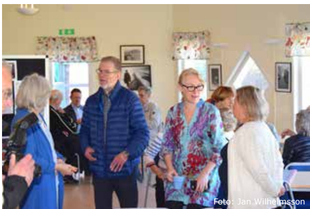
Öppet hus för Minnebergs ideella föreningar drog många besökare.