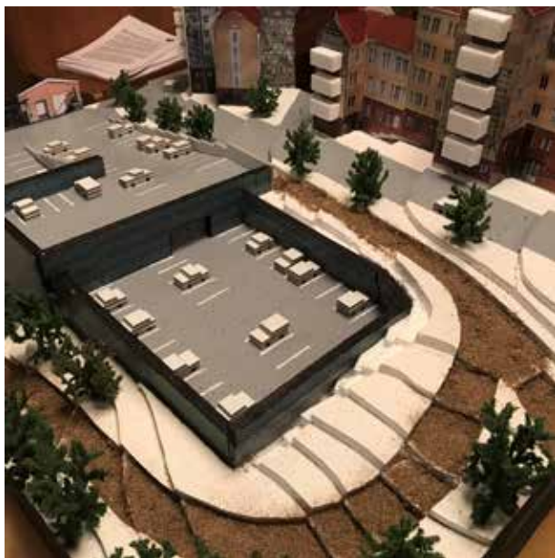
Modell av utbyggnad av parkeringshus P2.

Nu vidtar då projekteringsarbete, bygglovsansökan och därefter förfrågningsunderlag, riskanalys med mera. Fortlöpande kommer rapporter att läggas upp på samfällighetens hemsida www.minneberg.com och naturligtvis blir det också sammanfattningar i kommande infoblad.