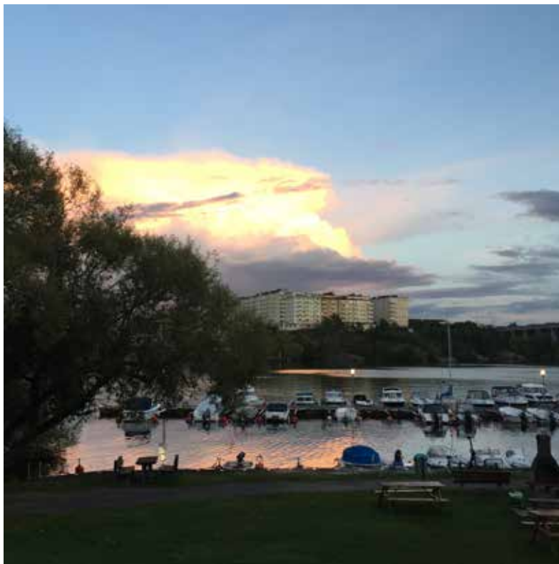
Skön sommarkväll i Båtviken

Sofie Wretström sofie.wretstrom@hsb.se 010-442 13 74