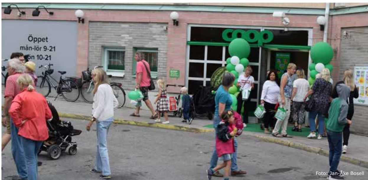
Minnebergarna lockades av de fina öppningserbjudandena och gladdes åt butikens uppräskning.

Denna butik är av stor betydelse för oss som bor i Minneberg och det är glädjande att Coop gjort denna investering.