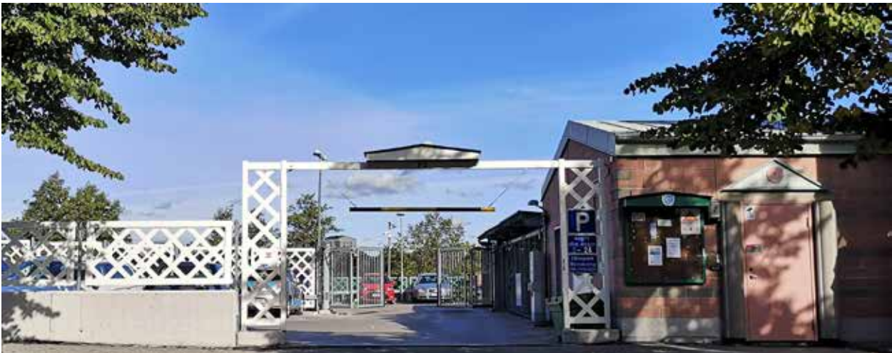
Garagegrinden vid P2